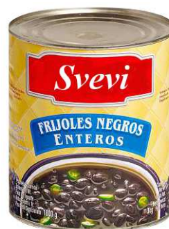
Art. 100568 Fagioli neri interi latta 3 Kg