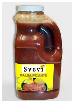
Art. 300487 Salsa rossa dip leggermente piccante, tanica 2 Kg