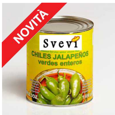
Art. 100103 Peperoncini Jalapenos verdi interi, latta 2,8 Kg