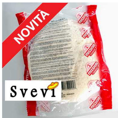
Tortillas precotte, conf. ATM da 18 tortillas (cons. fuori frigo) art. 205003 - Ø 6" / 16 cm art. 205004 - Ø 10" / 25 cm