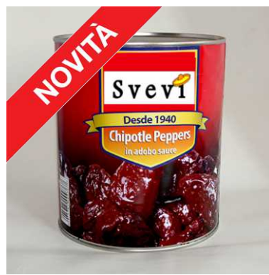
Art. 100301 Peperoncino Chipotle in salsa adobo, latta 2,8 Kg