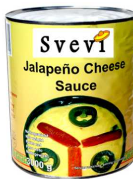
Art. 300241 Crema di formaggio e peperoncino Jalapeno latta 3 Kg