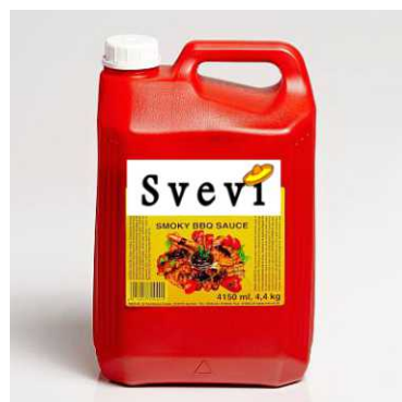
Art. 300401 Salsa BBQ ideale per carne alla brace, tanica 4,4 Kg