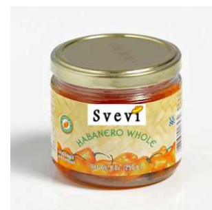
Art. 100486 Peperoncini Habanero interi, vasetto 250 g