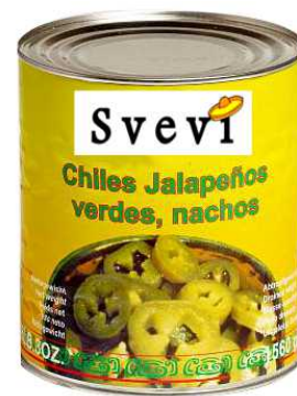
Art. 100400 Peperoncini Jalapenos verdi a fette, latta 2,8 Kg