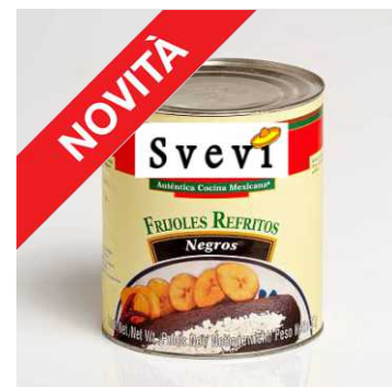
Art. 100544 Purea di fagioli neri stufati, latta 3 Kg